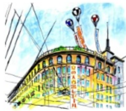
デパートの屋上遊園地が憧れでした

その昔、といってもほんの数十年前ほど前、過ぎ行く時代を惜しむ表現として『 明治は遠くになり にけり……』なんていう言葉を耳にしたものですが、平成もまもなく終わろうとしている昨今、昭和も同じような寂寥感が漂う、過ぎ去りし旧い時代になりつつあるんやなあ、なんて思う、今日この頃です。