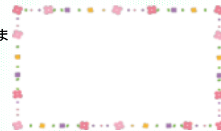
この枠の中に当たり！があれば吉

今号では弊社の創業30年を記念したプレゼント発表をしましたが、年4回、季節ごとにお届けしている本誌では、四季それぞれにちなんだ【季節のプレゼント】もご用意しています。これまでは、プレゼントご希望の方の中から抽選で決めていましたが、今回から方法を刷新、 当たりくじ 方式に変えてみました。下のお花で囲んである枠の中に 当たり！ の文字があった方はお申し出ください。今回49号、冬のプレゼント『福をかき集める熊手』の飾りをご進呈させていただきます。