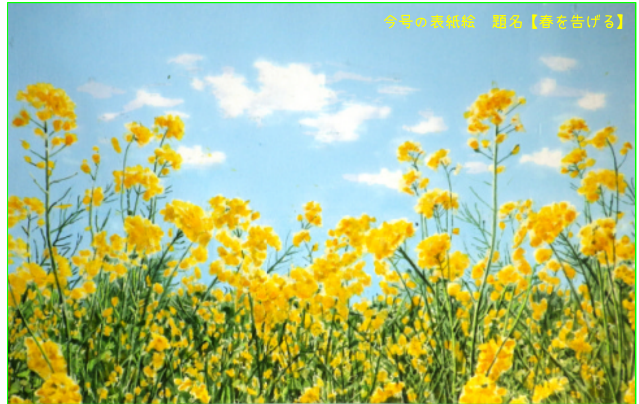
タイトル【春を告げる】・サイズ・(28.8cm×18.2cm)・水彩画・和紙