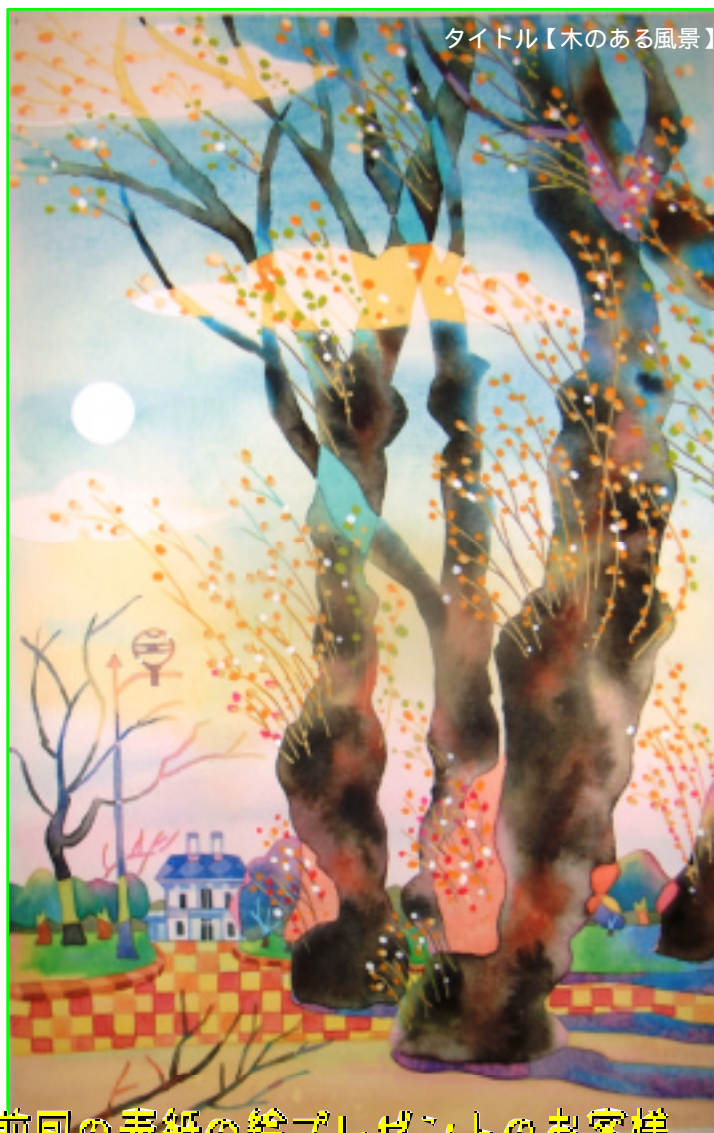
タイトル【木のある風景】

たとえば、最近気になってるものが... などございましたらお気軽にお申し付けください。